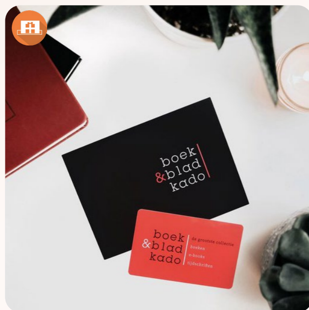
Bladcadeau of Boek&blad kado kaart Na het harde werken, hebben je collega's wel wat (lees-)rust verdiend! Deze cadeaukaarten zorgen voor weken leesplezier