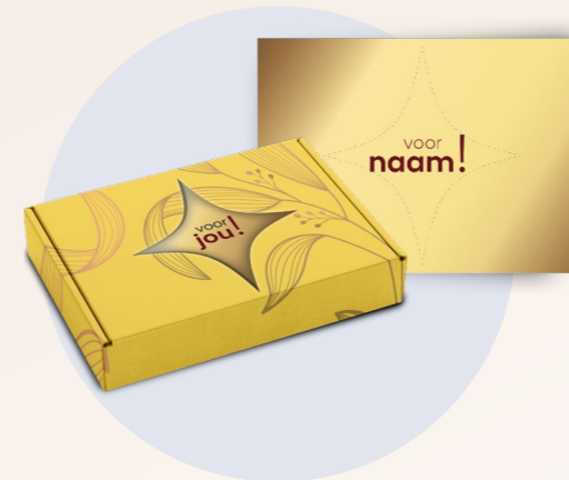
Brievenbusdoosje met kaart

Voeg een spark toe. Maak van Pasen een echte beleving en laat je collega's hun schoen zetten. Of verras ze met een leuk cadeautje van de Paasbaas dat op hun werkplek ligt. Een klein extra gebaar dat zorgt voor een blijvende herinnering.