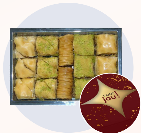
Product met sleeve