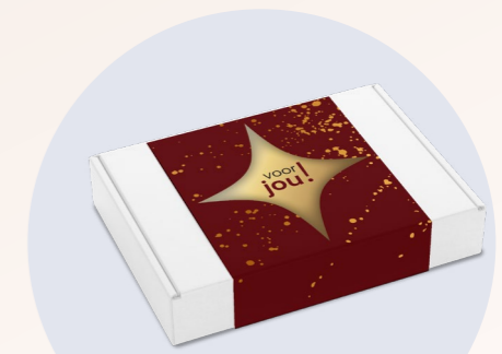
Brievenbusdoosje met sleeve