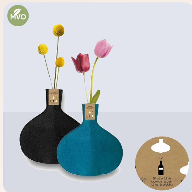
Recycled PET Bottle Vase 33x29cm Tover een lege fles wijn om tot een vaas met deze Bottle Vase! Schuif de cover om de lege fles. Leuk voor elk interieur.