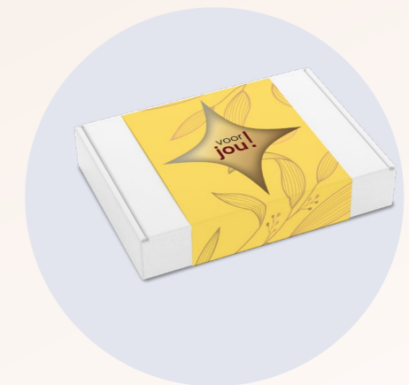
Brievenbusdoosje met sleeve