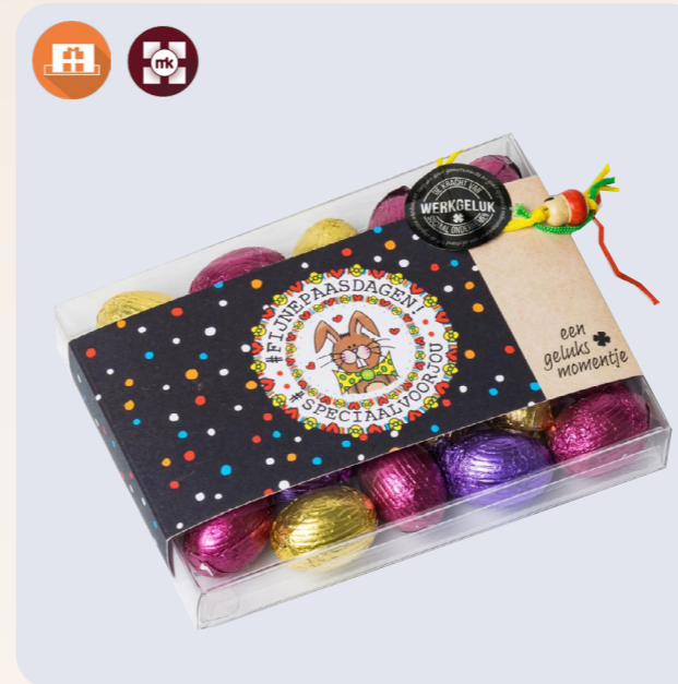
Postgroot paaseitjes 200g Een geluksmomentje in een luxe verpakkinginformatie!