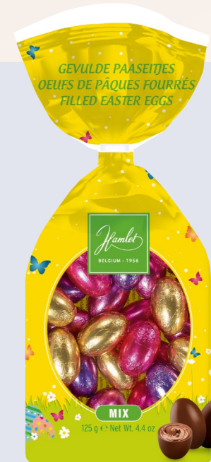
Paaseitjes melk/puur met hazelnootvulling 125g Paaseitjes in alle kleuren en smaken, om blij van te worden.