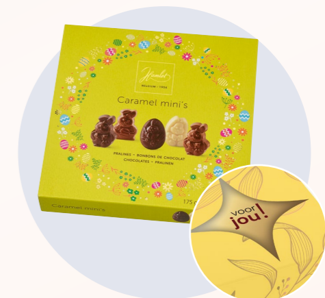
Product met sleeve

Meer informatie Klik hier en vraag onze adviseur naar de verpakkingsmogelijkheden en specificaties.