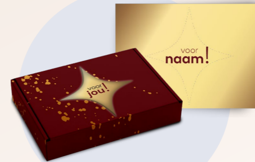
Brievenbusdoosje met kaart

Voeg een spark toe. Maak van het suikerfeest een echte beleving en laat je collega's hun schoen zetten. Of verras ze met een leuk cadeautje dat op hun werkplek ligt. Een klein extra gebaar dat zorgt voor een blijvende herinnering.