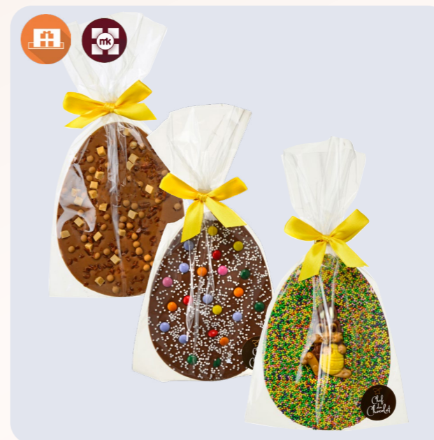
XL egg Bunny, Crunchy caramel, confetti Less is not more! Geef een reusachtig paasei voor al je collega's.